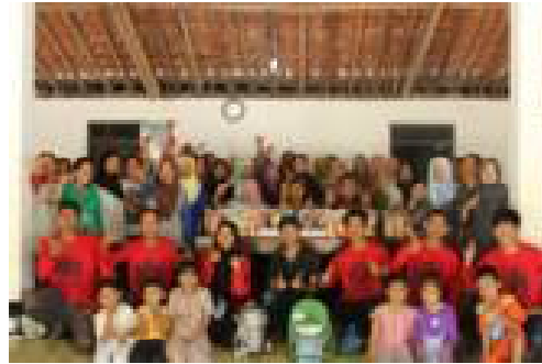
Gambar 7. Foto Bersama Selesai Kegiatan Pelatihan Pembuatan Keripik Singkong dengan Merk "Pik-Kong Nyai Semuluh Kidul"

Bahkan team pengabdian masyarakat juga mengikutkan 2 personil ibu-ibu untuk ikut pelatihan di Dinas Kesehatan Gunung Kidul mengikuti pelatihan sebagai salah satu syarat untuk mendapatkan Nomor PIRT. Nomor PIRT ini merupakan syarat yang harus dipenuhi agar KWT Pengrajin Keripik Singkong bisa bergerak secara leluasa untuk merambah pasar modern (seperti Swalayan, ataupun pasar modern lainnya yang banyak bertebaran di DIY.