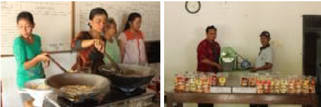
Gambar 5. Pelatihan Pembuatan Keripik Singkong bersama Gambar 6. Serah Terima Alat dan Produk Keripik Singkong yang Sudah di Kemasan

Setelah proses penggorengan dan proses spinner , dilanjutkan kegiatan packaging . Diakhir acara pelatihan pembuatan keripik singkong, dilakukan serah terima alat perajang singkong manual, automatic serta alat spinner dan bumbu keripik singkong aneka rasa, yang diserahkan dari team pelaksana pengabdian kepada kelompok wanita tani (KWT) pengrajin keripik singkong melalui Dukuh Semuluh Kidul (Gambar 6).