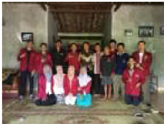
Gambar 2. Team Pelaksana Pengabdian Masyarakat Bersama Tokoh Masyarakat

Kegiatan pengabdian masyarakat dengan tema Peningkatan Ekonomi Masyarakat Melalui Pembuatan Keripik Singkong di Dusun Semuluh Kidul, Desa Ngeposari, Kecamatan Ngeposari, Gunung Kidul dilaksanakan oleh team pengabdian masyarakat (Gambar 2), yang terdiri dari seorang dosen yang dibantu oleh 10 orang mahasiswa. Kegiatan pengabdian masyarakat di Semuluh Kidul mencakup berbagai kegiatan sebagai berikut ini.