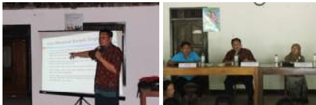
Gambar 3.. Penyuluhan Pembentukan KWT Pengrajin Keripik Singkong